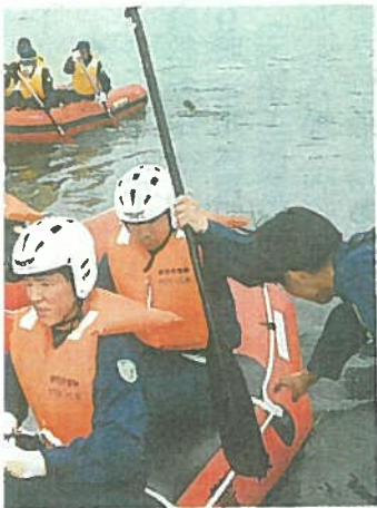
難救助訓練を実践する署員ら 1豆ゲートウェイ函南