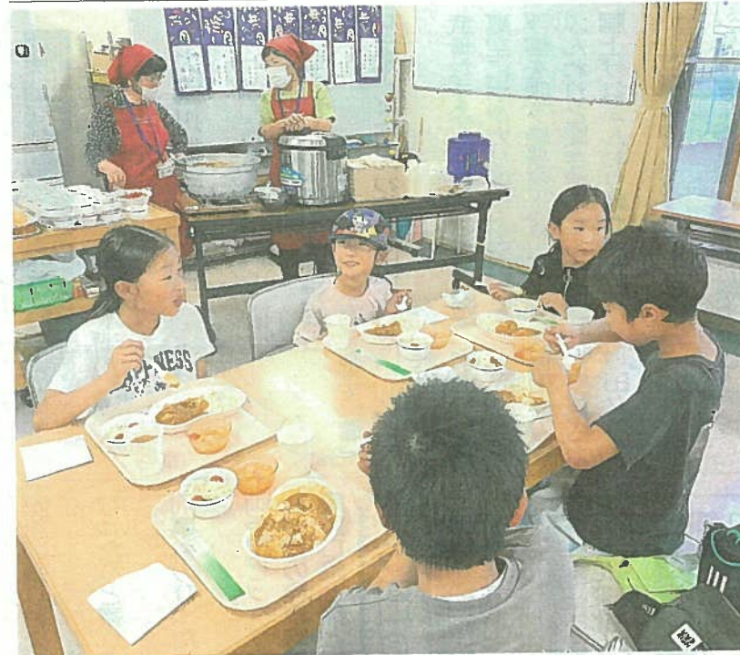
子ども食堂再開初日、提供されたカレーなどを味わう子どもたち(提供写真)

伊豆市牧之郷の地域密着型サービス「北狩野ケアセンター」は15日、「子ども食堂」を再開した。再開初日は地域の子どもの家族連れなど約20人が訪れ、カレーライスなどを味わった。